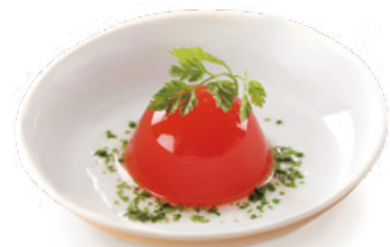
ブチトマトゼリー