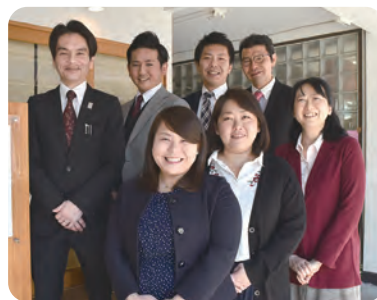
私たちにお任せください

特定技能所属機関は雇用した1号特定技能外国人に対し、日常生活や職業・社会活動の上で様々な支援をしなければなりません。これらの支援業務は言葉の壁や種々煩雑な手続きが伴うなど、日常業務に追われる介護施設等での個別対応は難しい場合が多く、また効率的でもありません。そこでこれらの業務を「登録支援機関」であるアメイジュに委託し、本体業務に専念することで、外国人の活用を積極的に進めることが可能となり、人材不足を補うことができます。