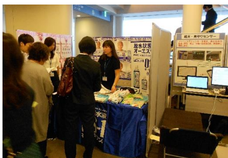
前回大会では、 32 社の出展がありました

会場3階には、各種協賛企業による介護用品、福祉機器等の展示コーナーを設置します。